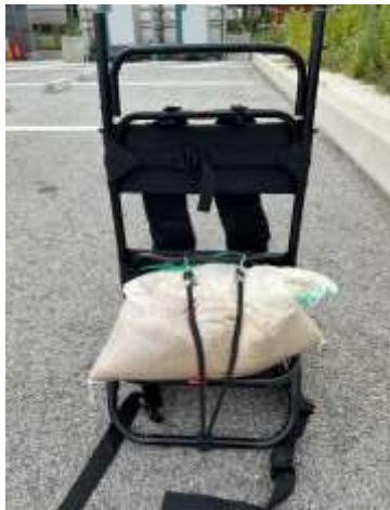
フック付きゴムを背中側のバーに引っ掛ける

天守台へ運搬後、透明な土のう袋に、白色の土のう袋を入れて、土のう上部に6mmロープを巻いてください