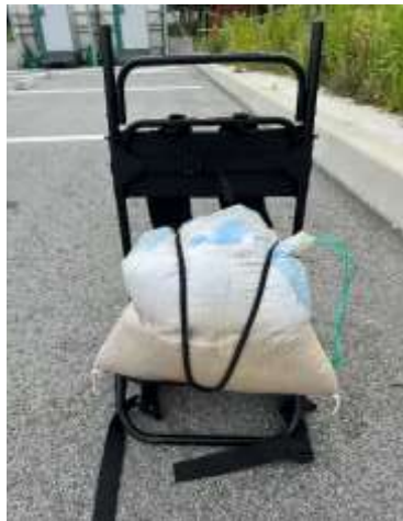
フック付きゴムを背中側のバーに引っ掛ける