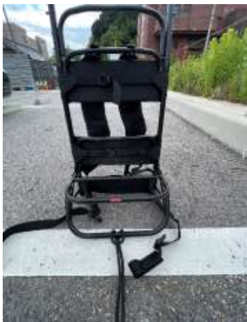
背負子の最下部のバーに、フック付きゴムをセット