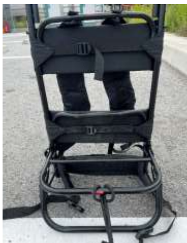
背負子の下から二番目のバーに、フック付きゴムをセット